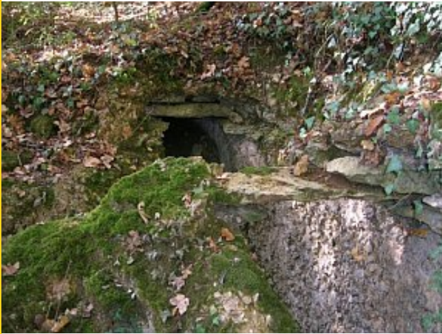
Vestiges de l'ancien aqueduc gallo-romain.

Le sol de Fontaine-le-Comte a révélé divers vestiges archéologiques : enclos de l'âge de Bronze, tronçons d'un aqueduc gallo-romain amenant l'eau des sources de Fontaine et Basse-Fontaine jusqu'à Poitiers, sépultures du haut Moyen Âge, atelier de potier du bas Moyen Âge, etc. Le nom de Chaumont est mentionné dès 1081 et l'abbaye est implantée au xii e siècle, suite à une donation de terres par Guillaume, duc d'Aquitaine et comte du Poitou. Cette dernière est à l'origine des grands défrichements qui ont modelé le paysage bien au-delà des limites de la commune actuelle, transformant brandes et essarts en terres d'exploitation sur lesquelles sont implantées des métairies. Plusieurs lieux-dits apparaissent à partir de cette époque : Poizac est cité dès 1149, le Léjat en 1184, la Foy en 1245, la Torchaise en 1250, la Bruère et la Rourie en 1286.