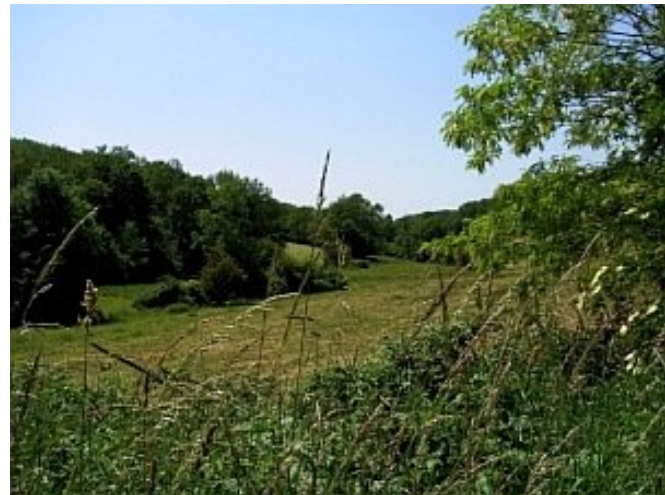
Vallée de la Feuillante.

Malgré une urbanisation rapide, le caractère rural de la commune est encore perceptible. Ce qui lui donne une morphologie contrastée : une concentration du bâti à l'est, tandis que la partie ouest présente un habitat dispersé au sein de terres agricoles.