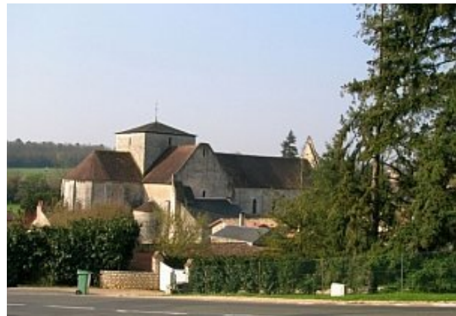
Église abbatiale. © Région Poitou-Charentes - CAP / C. Bunoz., 2005.

Après les troubles causés par la guerre de Cent Ans, puis par les guerres de Religion, l'abbaye se relève et conserve son influence. De nouveaux lieux-dits sont cités : les Barberies en 1434, les Piliers en 1510, la Devinalière en 1541, la Grange-Neuve en 1543, le Chêne-Sapin en 1576, la Maison-Bruleau et la Loge en 1604, le Four ou la Tuilerie en 1612, Préjasson en 1640 et la Montagne en 1648. Cependant, à partir du xvii e siècle, le déclin de l'abbaye conduit des bourgeois de Poitiers à acquérir des terres pour les exploiter, comme la propriété des Piliers qui devient un immense domaine couvrant plus de 500 hectares.