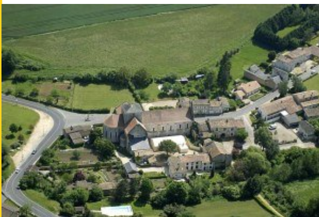
L'ancien bourg, près de l'abbaye.