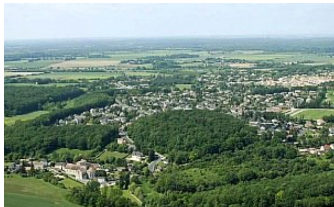
Nouvelle agglomération sur le plateau, au-dessus de l'ancien bourg.

La population reste assez stable jusque dans les années 1970 avec : 557 habitants en 1790, 570 en 1801, 702 en 1876, 628 en 1901, 533 en 1946, 665 en 1968. Puis elle connaît une augmentation considérable puisqu'elle atteint 3 569 habitants en 1999. Le nombre de logements suit logiquement la même évolution : 148 feux en 1790, 110 logements en 1949, 219 en 1968 et 1 133 en 1999. Ce brusque accroissement du nombre de résidents s'est donc accompagné, en plus de la construction de logements, de celle d'équipements adaptés aux nouveaux besoins – mairie, poste, complexe scolaire, équipements sportifs et culturels – et de quelques commerces de proximité, constituant une agglomération devenue centre d'activités. Dans le même temps, le cimetière devenu trop exigu a été remplacé par un nouveau installé à l'écart au lieu-dit le Chêne-Blanc. Enfin à l'est, en bordure de la R. N. 10, une zone d'activité commerciale, aujourd'hui en cours de réaménagement, a été construite.