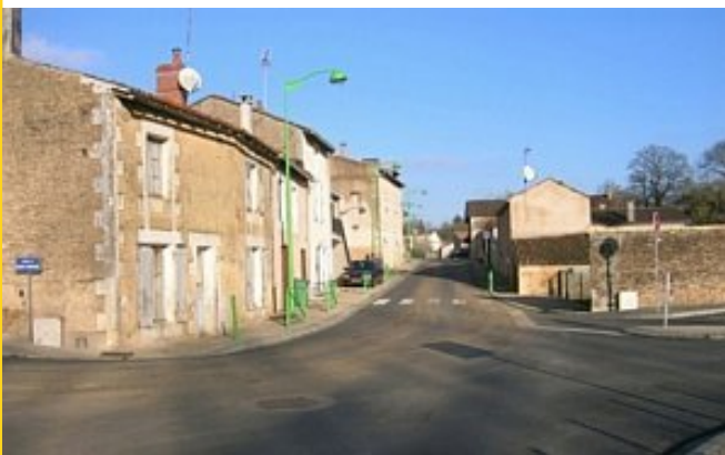
Hameau de Basse-Fontaine.

De nouveaux lieux-dits s'ajoutent ensuite et figurent sur la carte de Cassini dessinée dans la seconde moitié du xviii e siècle : Audemont, Beaurepaire, la Douardière, les Essarts, Haute et Basse-Fontaine, la Montagne et la Tillole. En 1837, le plan cadastral indique des implantations supplémentaires : la Catinerie, le Cossy, la Galettrie et les Nesdes.